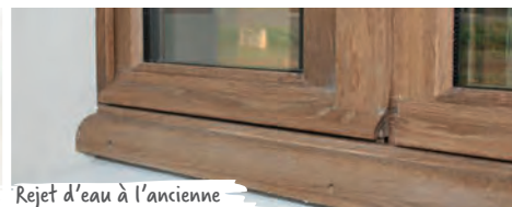
Rejet d'eau à l'ancienne