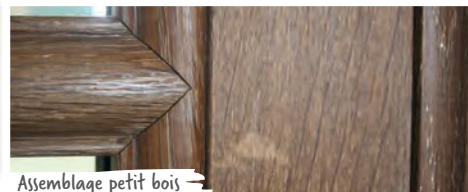
Assemblage petit bois