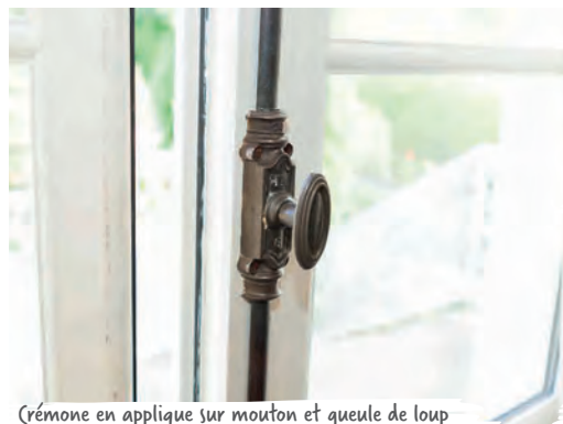
Crémone en applique sur mouton et gueule de loup