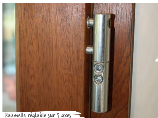
Paumelle réglable sur 3 axes