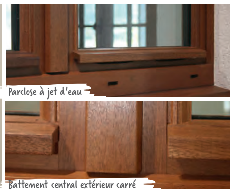
Parcloses à jet d'eau